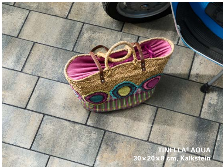
TINELLA® AQUA 30 x 20 x 8 cm, Kalkstein

Verwenden Sie drainagefähiges Fugenmaterial „Basalt 1–3 mm“, ein Pflasterbettungsmaterial „Basalt 2–5 mm“ sowie einen drainagefähigen Unterbau. Regenwasser kann bei dieser Bauweise schnell abfließen und wird auf kürzestem Wege wieder dem Wasserkreislauf zugeführt.